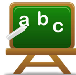
Actio School Formação