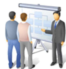
Conferências Atividades Públicas