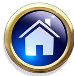
Web Actio www.actio-consulting.com